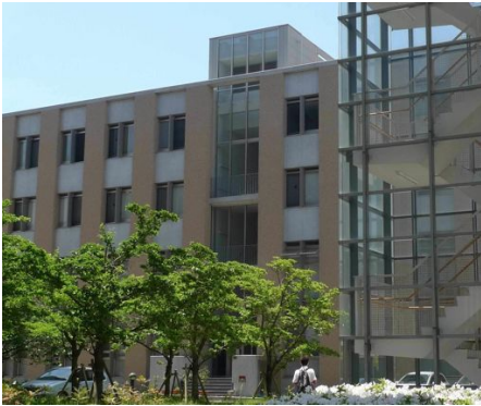
エポックの左手にラルカディアの 建物が見えます