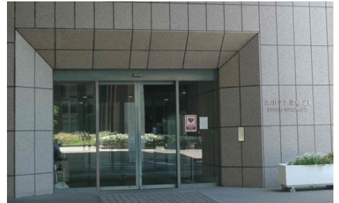
エポックの入口 (A, B会場; ポスター会場)