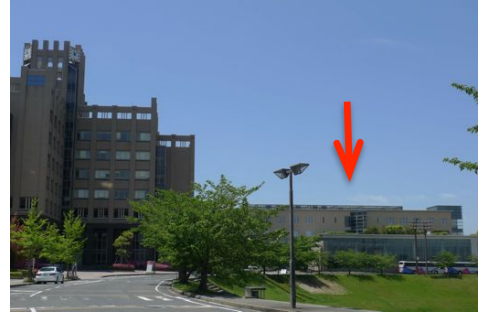
右手にエポック立命館21の 建物が見えます